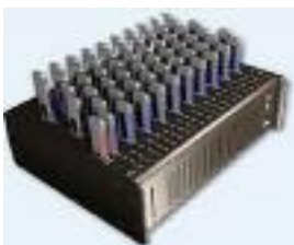
Dispositivo con alimentación externa y conexión a puerto USB capaz de copiar archivos simultáneamente a 100 unidades de memoria USB